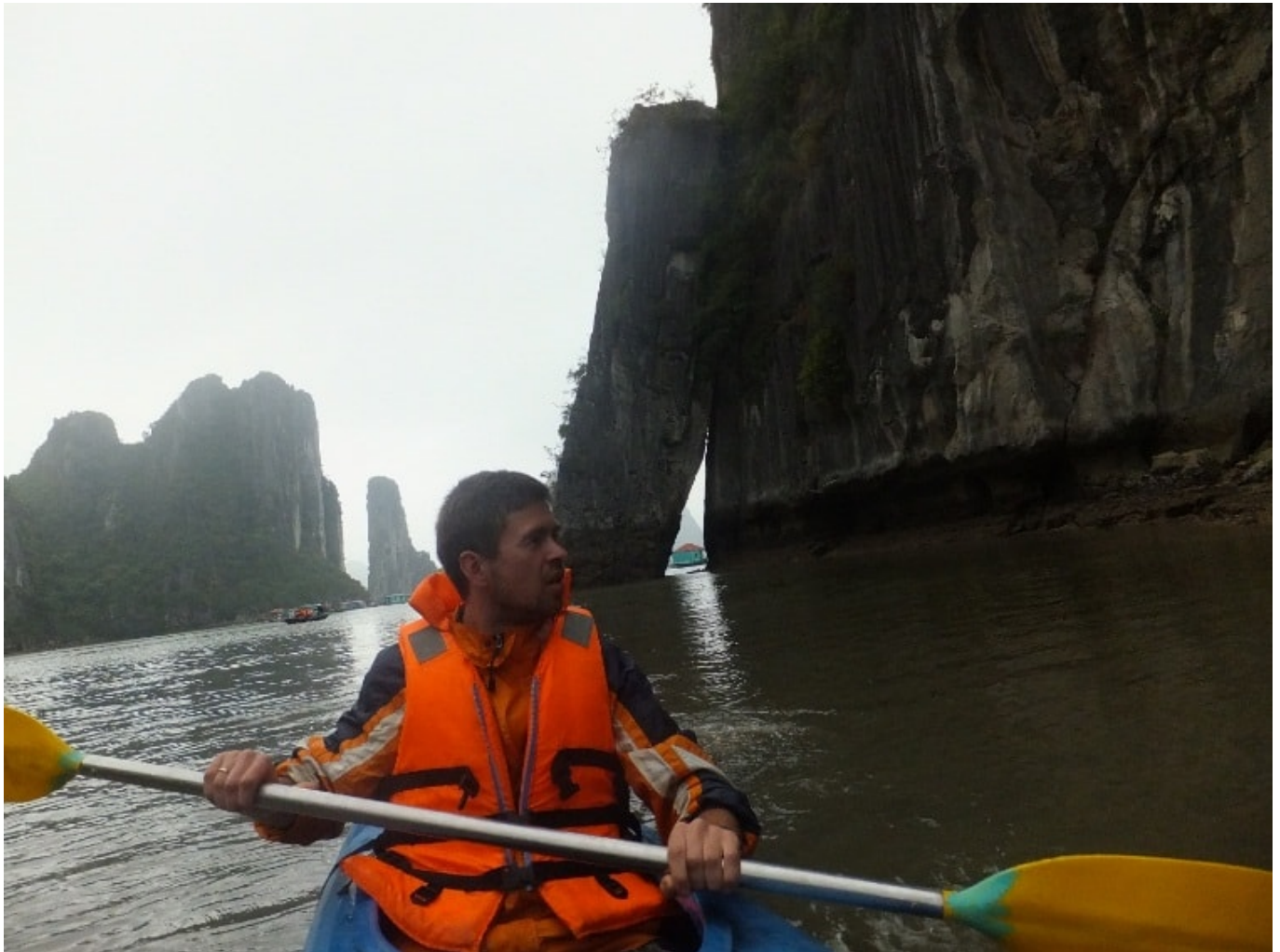
Taupymo dilema 25 balsai/ Vid.4.7